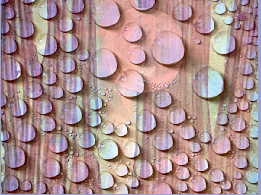
Theresia Hefe: Regentropfen, 2024 | Karton, Mischtechnik, 38,5 x 26 cm