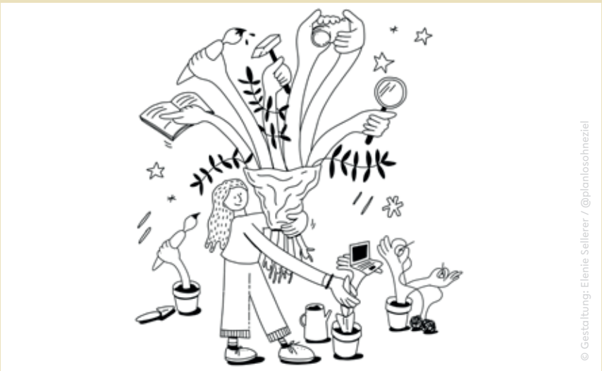
© Gestaltung: Elenie Sellerer / @planlosohneziel