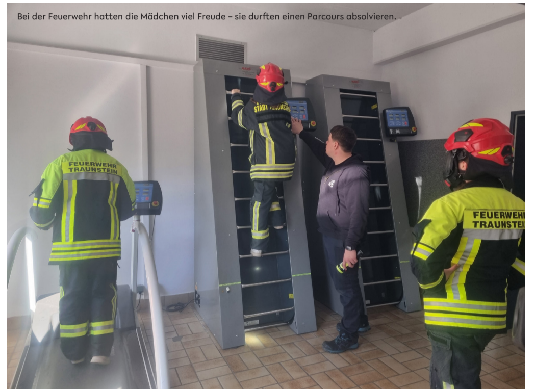
Bei der Feuerwehr hatten die Mädchen viel Freude – sie durften einen Parcours absolvieren.

Der Girls' and Boys' Day bietet jedes Jahr eine wertvolle Gelegenheit, Klischees bei der Berufswahl aufzubrechen und jungen Menschen neue Perspektiven zu eröffnen. Auch die Stadt Traunstein freut sich, mit ihrem vielfältigen Angebot dazu beitragen zu können.