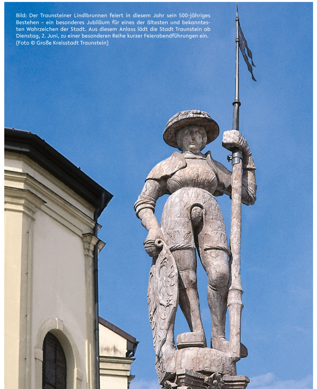
Bild: Der Traunsteiner Lindlbrunnen feiert in diesem Jahr sein 500-jähriges Bestehen – ein besonderes Jubiläum für eines der ältesten und bekanntesten Wahrzeichen der Stadt. Aus diesem Anlass lädt die Stadt Traunstein ab Dienstag, 2. Juni, zu einer besonderen Reihe kurzer Feierabendführungen ein.

Die rund 20-minütigen Führungen sind kostenlos, eine Anmeldung ist nicht erforderlich. Alle Informationen zu Terminen und Themen gibt es unter www.traunstein.de/brunnengeschichten .