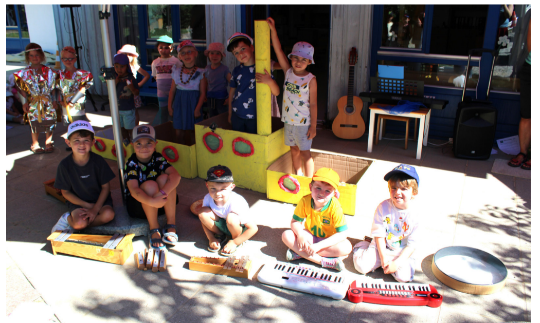
Die Kinder der Kindertageseinrichtung am Klosterberg begeisterten beim Sommerfest unter dem Motto „Musik verbindet“ mit kreativen Aufführungen, selbst gestalteten Requisiten und viel Freude an der Musik.

Das Sommerfest bot darüber hinaus viel Gelegenheit für Begegnungen und Gespräche zwischen Familien und dem pädagogischen Team. Gemeinsam verbrachten Kinder, Eltern und Fachkräfte einen unbeschwernten Vormittag im Garten der Einrichtung. Strahlende Gesichter, fröhliches Lachen und mitreißende Klänge machten deutlich, dass das Motto „Musik verbindet“ nicht nur auf der Bühne, sondern während des gesamten Festes gelebt wurde.