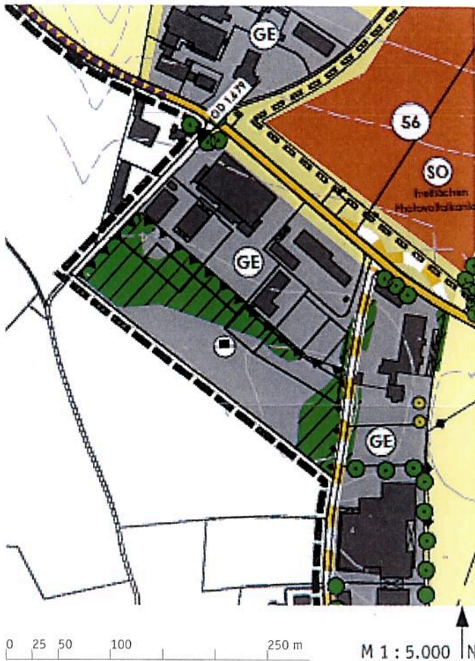
Ausschnitt aus dem gültigen Flächennutzungsplan